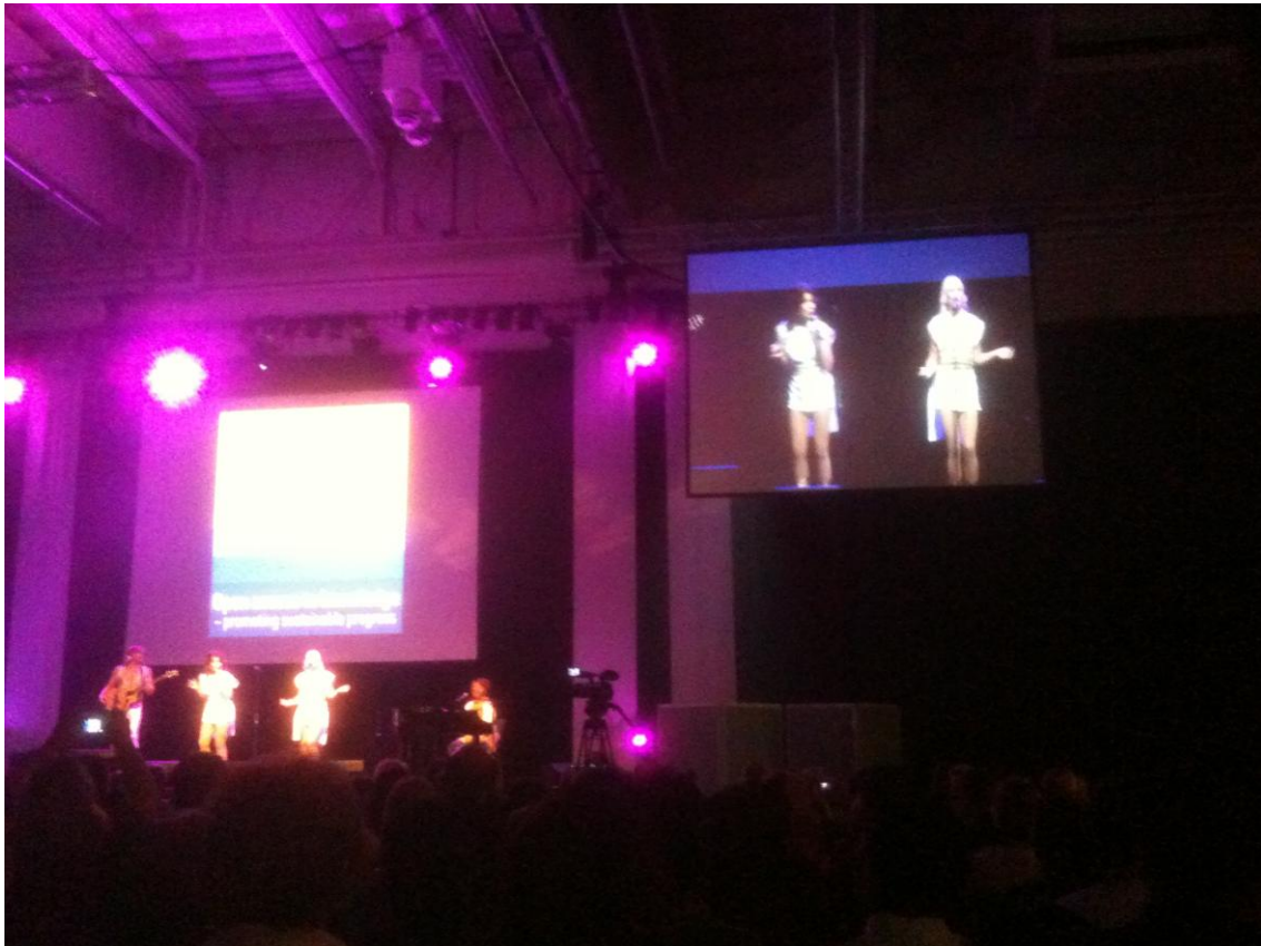
Abbildung: Die ABBA-Coverband bei der Opening session

Insgesamt gesehen sind informelle Gespräche bei einem IFLA-Kongress sicher noch wichtiger als bei anderen Veranstaltungen. So war etwa der Plausch mit meiner Nachbarin bei der Postersession, einer in Japan geborenen Bibliothekarin von der Rutgers University in den USA, ein großer Gewinn. Oder ich erinnere mich besonders gerne an die Schilderungen des Kollegen aus Nigeria bei einer Session der wissenschaftlichen Bibliotheken, dessen Grundprobleme in der ausreichenden Versorgung mit Elektrizität und Netzbandbreite bestehen. Insgesamt soll die IFLA-Konferenz wohl genau das leisten: Ein Verständnis für die spezifischen Fragestellungen und Probleme in Bibliotheken in anderen Teilen der Welt und gleichzeitig ein Gemeinschaftsgefühl unter Bibliothekar/innen schaffen.