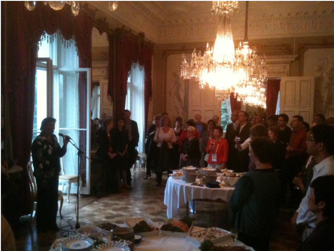
Abbildung: Der Empfang des Goethe-Instituts im Dickinson Palast

Während des Kongresses fand zudem in den Messehallen die übliche Anbiertermesse statt, und dort wurden auch die ca. 150 Poster aus aller Welt zu allen denkbaren bibliothekarischen Themen präsentiert. An zwei Tagen wurden die Plakate von den jeweiligen Fachleuten für einige Stunden präsentiert, und aufgrund des Tagungsthemas waren offensichtlich besonders die Poster zu Open Access gefragt. So hatte ich vielfach Gelegenheit, die Informationsplattform „open access net“ zu erklären und darüber mit vielen Kolleg/innen ins Gespräch zu kommen. Das Interesse an der Plattform aus allen Teilen der Welt war ausgesprochen hoch, und möglicherweise wird sich noch die eine oder andere Nachnutzung ergeben.