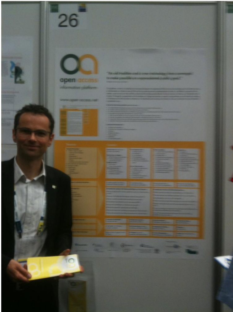
Abbildung: Poster „open access net“

Daneben hatte ich Gelegenheit, mir selbst einige der anderen Poster anzuschauen und mit den jeweiligen Kolleg/innen zu diskutieren. Mein persönlicher Favorit war das Plakat eines finnischen Kollegen, der zum Thema „Library + space + web + mobile“ die Ideen und Fragen der Besucher/innen über die Verbindung von Bibliotheksraum, Internet- und v.a. mobile Nutzung abfragte. Diese wurden anschließend auf kleinen Post-its gesammelt und danach auf seinem Poster verewigt.