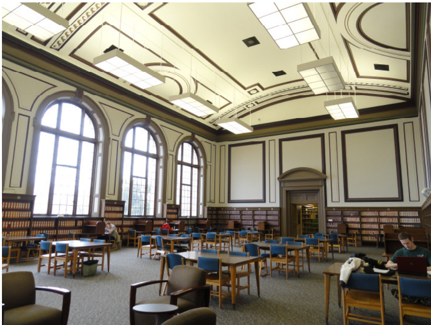
Abb. 2: Ein Lesesaal der Universitätsbibliothek Columbia

Bei einem Wochenendausflug nach Columbia besuchte ich die Hauptbibliothek der Universität auf dem Campus, die mit etwa 3 Millionen Bänden die größte wissenschaftliche Bibliothek in Missouri ist und den Stellenwert einer Regionalbibliothek innehat. Alle Bücher sind freihand aufgestellt, teilweise in verwinkelten Freihandmagazinen. Den Studenten stehen mehrere Lesesäle zur Verfügung, die entweder mit Einzelsehlplätzen oder auch mit Gruppenarbeitsplätzen für je vier Personen ausgestattet sind. Die Öffnungszeiten sind sehr großzügig, von Montag bis Donnerstag hat die Bibliothek von 7.30 Uhr bis 2 Uhr nachts geöffnet, am Wochenende gelten eingeschränkte Öffnungszeiten.