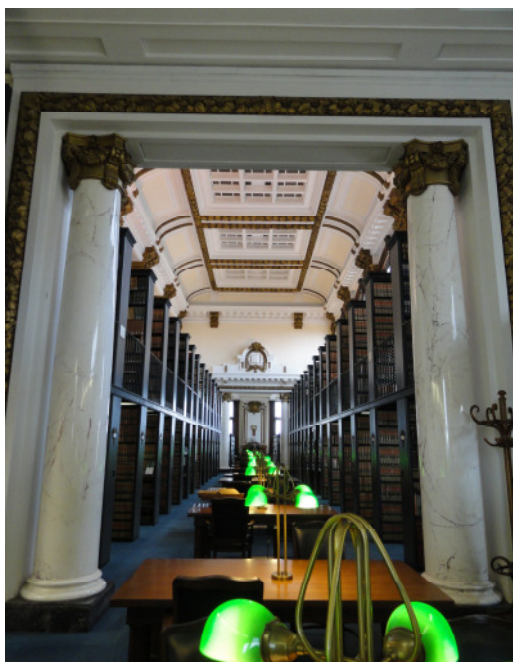
Abb. 2: Supreme Court Library

Nicht weit weg von der MOSL befindet sich das Kapitol, der Regierungssitz des Staates Missouri, in dem auch die Sitzungssäle des Senats und des Repräsentantenhauses untergebracht sind. Ich besuchte die Bibliothek des Kapitols, die einen stark repräsentativen Charakter besitzt. In ehrwürdiger Umgebung ziehen sich Regale und Vitrinen in die Höhe, die mit ordentlichen Bücherreihen bestückt sind. Der Hauptzweck der Bibliothek besteht darin, Abgeordneten oder Mitarbeitern in deren Pausen einen repräsentativen Aufenthaltsraum zu bieten, um z.B. Zeitung zu lesen.