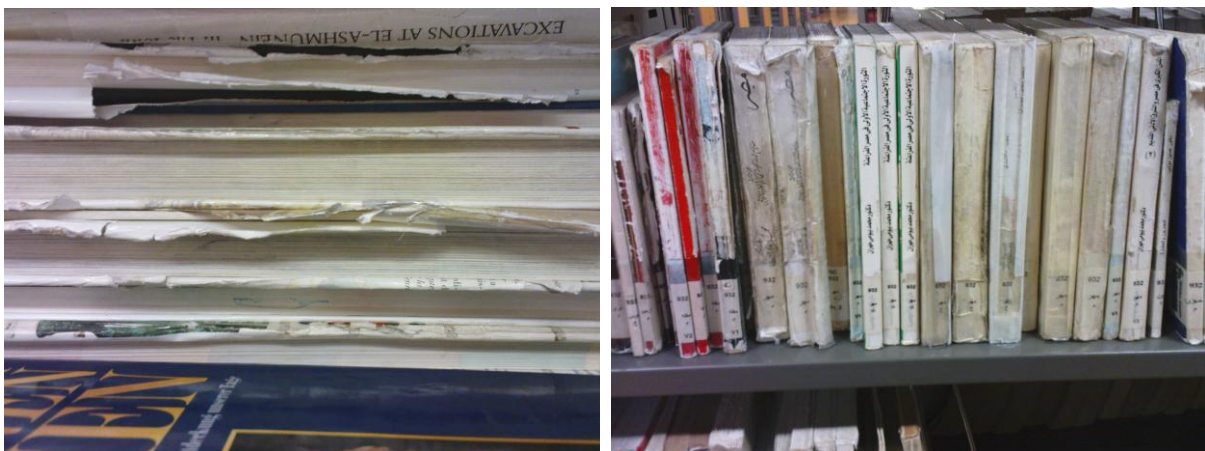
Abb. 13–14: BA, Bestände

Welchen Spagat die BA hier aushalten muss, um erfolgreich Pionierarbeit im arabischen Raum leisten zu können, wird im Kontrast zwischen der hochwertigen Gestaltung der Innenarchitektur (s. Abb. 6–7) und der Ausstattung eines großen Teil der Arabisch sprachigen Literatur deutlich: