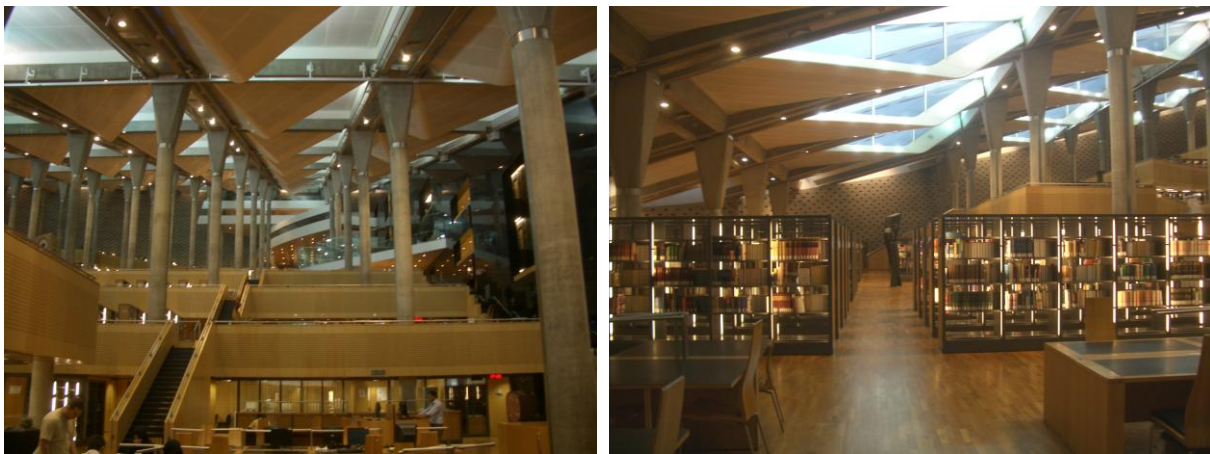
Abb. 6-7: Bibliotheca Alexandrina, Lesesaal