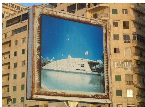
Abb. 8–9: Regalbeschriftung nach DDC; Werbung für die Bibliothek in der Stadt