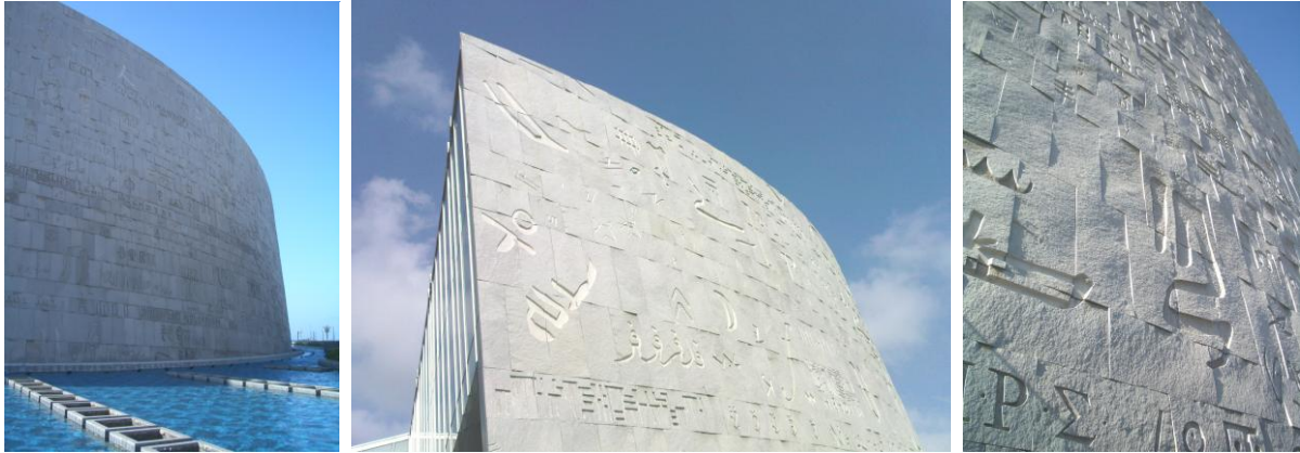
Abb. 3–5: Bibliotheca Alexandrina, Südfassade mit Schriftzeichen