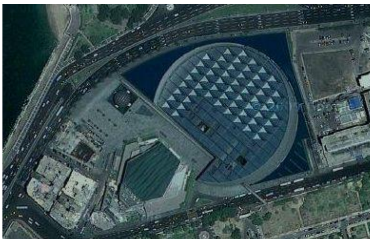
Abb. 2: Satellitenfoto des Geländes mit Bibliotheksgebäude (Mitte), Kongresszentrum (unten links), Planetarium (Mitte links) und Mittelmeer (oben links)