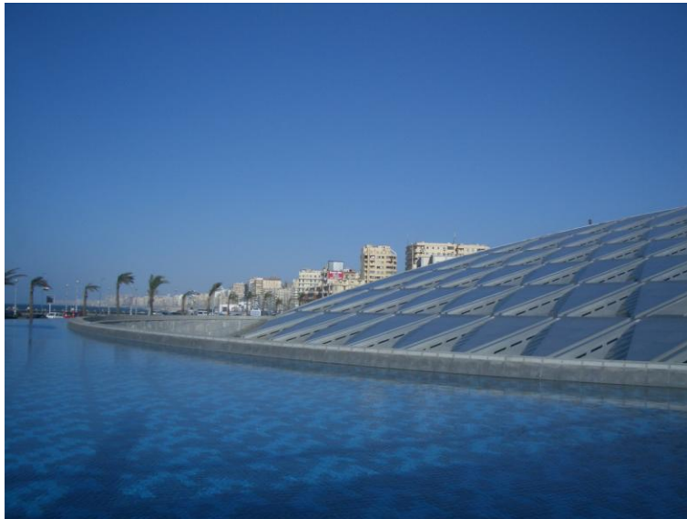
Abb. 1: Bibliotheca Alexandrina, Außenansicht Norden