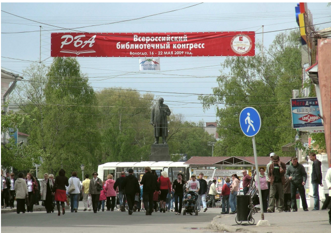
Abb. 2: An verschiedenen Orten wird in der Stadt auf den russischen Bibliothekskongress hingewiesen, hier am Eingang zu einer Flaniermeile im Zentrum mit dem Lenindenkmal aus sowjetischer Zeit.

Einkommensgestaltung für bibliothekarische Berufe, aber auch die Aufgaben vor allem öffentlicher Bibliotheken bei der patriotischen Erziehung der Jugend. Insgesamt boten über 400 Vorträge eine breite Grundlage für Erfahrungsaustausch und Diskussion.