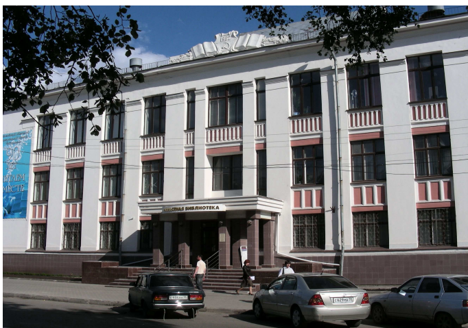
Abb. 1: Das 1962 errichtete Hauptgebäude der Allgemeinwissenschaftlichen I.W. Babuschkin-Bibliothek des Gebietes Wologda, in der zahlreiche Veranstaltungen des Kongresses stattfanden.

Wo liegt eigentlich dieses Wologda? Die Reise führt zunächst nach Moskau. Vom dortigen Jaroslawler Bahnhof führen die Eisenbahnlinien nach Norden in Richtung Weißes Meer. Doch schon etwa 460 km hinter Moskau steigt man nach einer Nacht im Schlafwagen in Wologda aus. Die um 1147 gegründete Stadt ist heute der Lebensmittelpunkt von ca. 300.000 Einwohnern. Sie beherbergt eine Allgemeinwissenschaftliche Gebietsbibliothek, eine Universitäts-, mehrere Instituts- und zahlreiche öffentliche Bibliotheken. Auf dem vorjährigen Bibliothekskongress der RBA ist Wologda mit dem Titel der Russischen Bibliothekshauptstadt 2009 geehrt worden und veranstaltete somit diesen Jahreskongress der RBA.