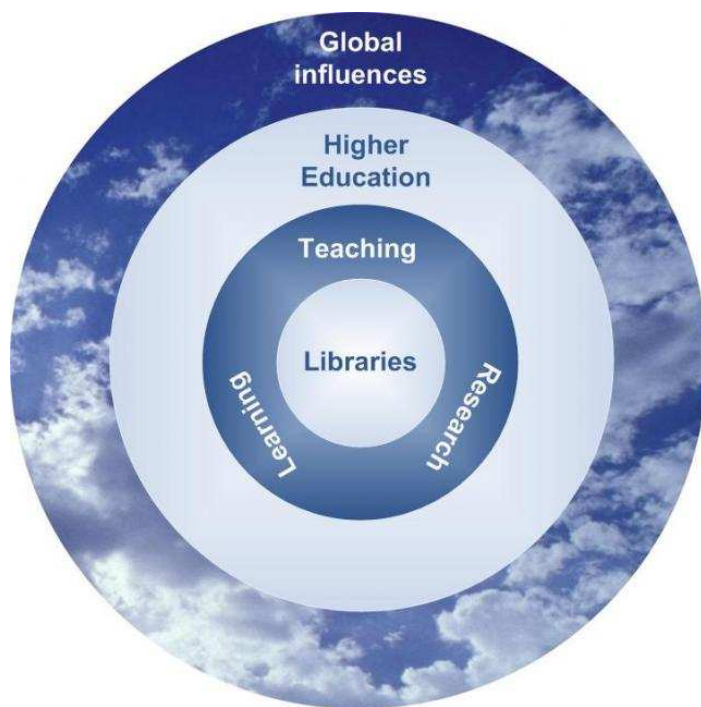
Abbildung 1: Einflussfaktoren für Higher education in UK – Skizze von Curtis+Cartwright

In Vorbereitung für den zweiten Workshop wurde an die Teilnehmerinnen und Teilnehmer ein Papier verschickt, das – basierend auf den Einflussfaktoren – acht Fragen (Key Questions) enthält, auf deren Grundlage die Zukunft der Higher Education im engeren Sinne untersucht werden sollte. Diese überwiegend als Alternativen formulierten Fragen (z.B. „Are values in Higher Education open or close?“, „Is Higher Education nationally or globally bounded?“, „Is the