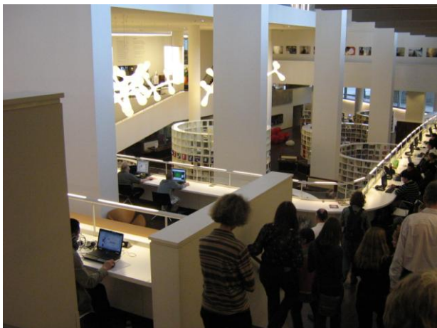
Durchblick durch Geschosse und Abteilungen