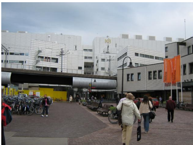
Außenansicht vom Hauptbahnhof kommend

Der Umstand, dass sich die Niederländische Nationalbibliothek nicht in der Hauptstadt Amsterdam, sondern am Regierungssitz in Den Haag befindet, machte eine Exkursion dorthin notwendig.