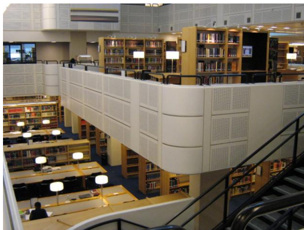
Lesesaal mit Freihandbereichen und Arbeitsplätzen

Die Königliche Bibliothek liegt in Den Haag direkt am Hauptbahnhof und ist in einem riesigen Gebäudekomplex aus den 80er Jahren untergebracht, der außerdem das Nationalarchiv beherbergt. Hier die wichtigsten Fakten in der Übersicht: