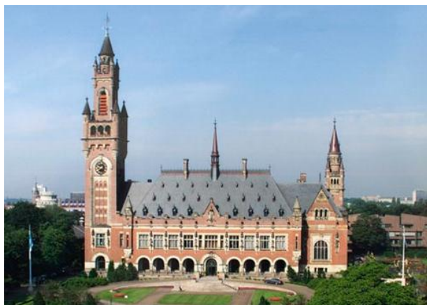
Außenansicht des Vredespaleis

Wer sich vor der Führung nicht mit der Einrichtung beschäftigt hatte, wusste nicht so recht, was ihn erwartete. Manch einer befürchtete womöglich, eine langweilige juristische Fachbibliothek mit verstaubten Loseblattsammlungen in modrigen Kellergewölben präsentiert zu bekommen. Doch weit gefehlt!