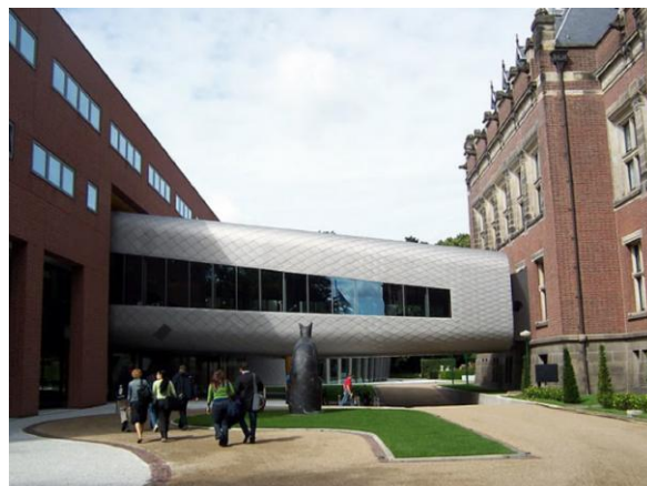
Der Lesesaal als Verbindungstrakt zwischen Bibliothek und Paleis