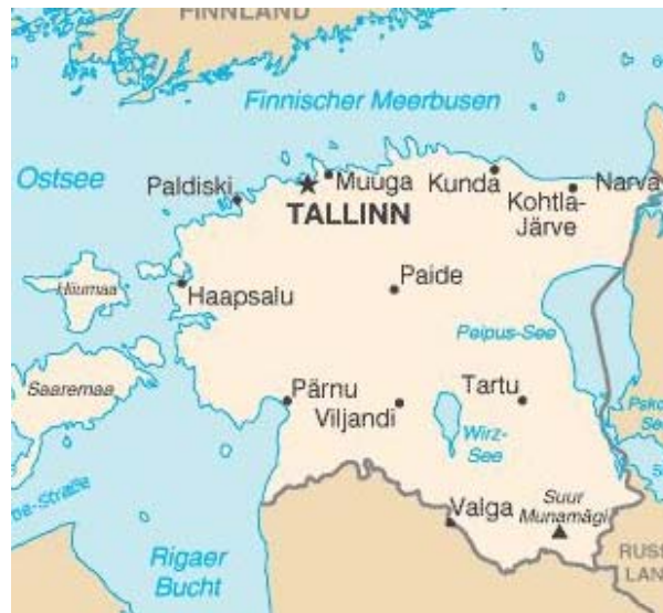
Abbildung 3: Karte von: http://de.wikipedia.org/wiki/Estland

Tartu ist eine Stadt von ca. 110.000 Einwohnern im Südwesten Estlands. Fast 80% der Tartuer sind Esten, 16% Russen. Besonders bekannt ist die Stadt für ihre Universität, die auf eine lange akademische Tradition zurückblickt.