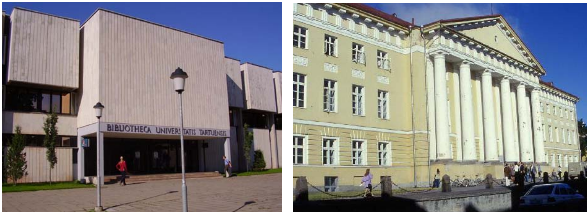
Abbildung 4: Die Bibliothek in Tartu (links), das Hauptgeb. der Uni (rechts) 7

An der Bibliothek der Universität wurde ich von Frau Malle Ermel betreut, die als eine senior specialist an der UB tätig ist. Die Hauptbibliothek befindet sich im Zentrum von Tartu nahe am Hauptgebäude der Universität. Die Räume wurden im Jahr 1982 bezogen, vorher war man im umgebauten Chorteil der Ruine der Domkirche auf dem Domberg beheimatet.