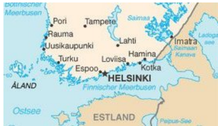
Abbildung 6