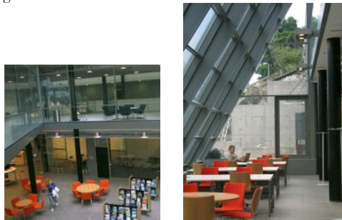
Abbildung 8: Zwei Einblicke in die Bibliothek

Als ich die Bibliothek besuchte, war sie noch nicht lange in ein neues Gebäude umgezogen, die offizielle Einweihungsfeier stand noch bevor: