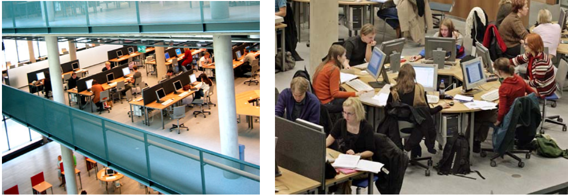
Abbildung 11: Das Aleksandria Learning Center 9

Komplettiert wird die Palette durch ein erweitertes Sprachlabor. Im „Language Center“ können Studenten und Mitarbeiter der Universität fast jegliche beliebige Sprache erlernen. Dazu stehen Multimedia Materialien bereit (CDs, Videos, Ausspracheübungsplätze...) und es werden Kurse angeboten. Auf http://www.helsinki.fi/aleksandria/english/presentation/index.htm kann man sich ein Video über das wirklich sehr beeindruckende Zentrum ansehen.