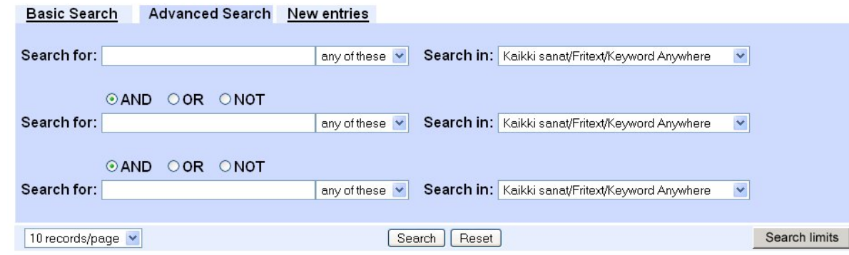
Abbildung 9: Die Suchoberfläche von Helka

Database Name: HELKA - Helsingin yliopiston kirjastot