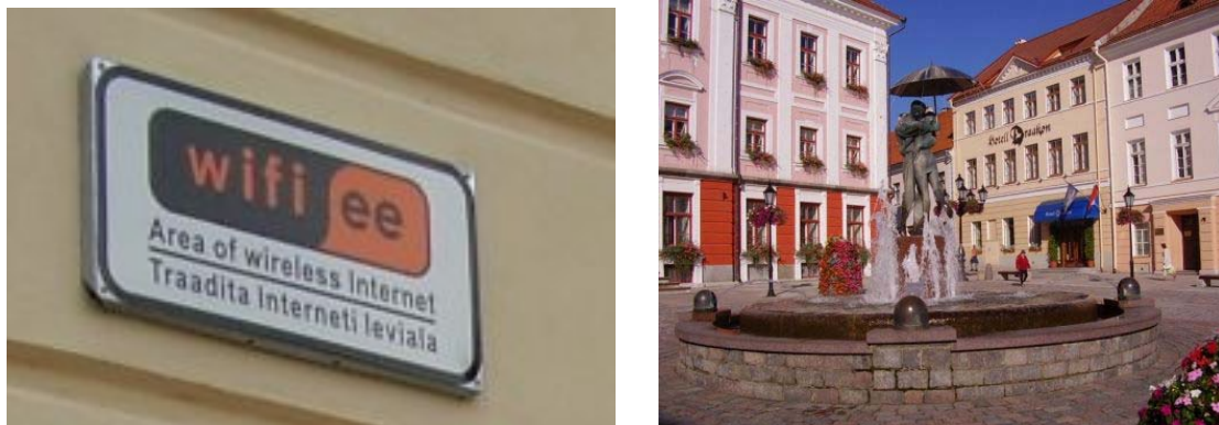
Abbildung 2: Wi-fi am Rathausplatz in Tartu („ee“ ist die Top-Level Domain für Estland)

Fidelity) Hotspots, ein großer Teil davon ist kostenlos. Am 15. Oktober 2005 gab es in Estland eine Weltpremiere: zur landesweiten Kommunalwahl konnten die Esten ihre Stimme innerhalb einer Woche online abgeben. Dazu benötigten sie nur den digitalen Personalausweis und einen Zugang zum Internet – wählen war also z.B. auch in der Bibliothek möglich. Estland war in dieser Hinsicht schneller als alle anderen Länder. Obwohl in den US-Staaten Michigan und Arizona schon jeweils einmal Vorwahlen online statt fanden, gab es bislang noch nirgends sonst landesweite Online-Wahlen. Die Esten sehen sich selbst als ein höchst fortschrittliches Volk, sie nennen ihr eigenes Land gern „E-stonia“, um auf ihre Netzbegeisterung zu verweisen.