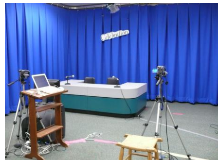
Nachrichtenstudio in der Schul-Bibliothek einer Grundschule

Pragmatismus ist ein Schlüsselwort, auch wenn es um den Einsatz von Technik an der Schule geht. Ganz häufig scheinen die Schulbibliothekar/inn/e/n hier eine Nische gefunden und gefüllt zu haben. Zusammen mit dem „Technologie-Personal“ – zuständig für die PCs an der Schule – sind sie Ansprechpartner/innen für alles, was Schule heute an Technik vorhält. Die Bibliothek ist eben kein Ort der Bücher allein, sondern das reale Medienzentrum der Schule. Und dazu gehören Fernseh- und Tonstudios zur Übertragung der täglichen Schulnachrichten genauso wie der souveräne Umgang mit Laptop, Beamer und Smartboard.