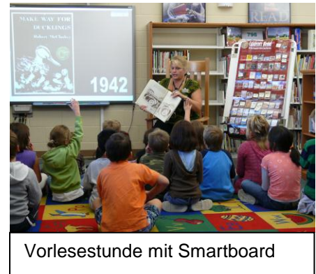
Vorlesestunde mit Smartboard

Was wir nach drei intensiven Wochen mitnehmen, ist das Bild eines professionellen und vielfältigen Schulbibliothekssystems, das vom Engagement vieler Schulbibliothekar/inn/e/n lebt. Vieles ist nicht übertragbar – aufgrund unserer völlig anders strukturierten Bildungslandschaft und der Unterschiede in der pädagogischen wie bibliothekarischen Ausbildung. Aber die vielen Best-Practice-Beobachtungen, die wir im Alltag machen konnten, sind nicht minder wichtig. Daran können wir anknüpfen und eine Fülle von Impulsen auch bei uns in Deutschland umsetzen.